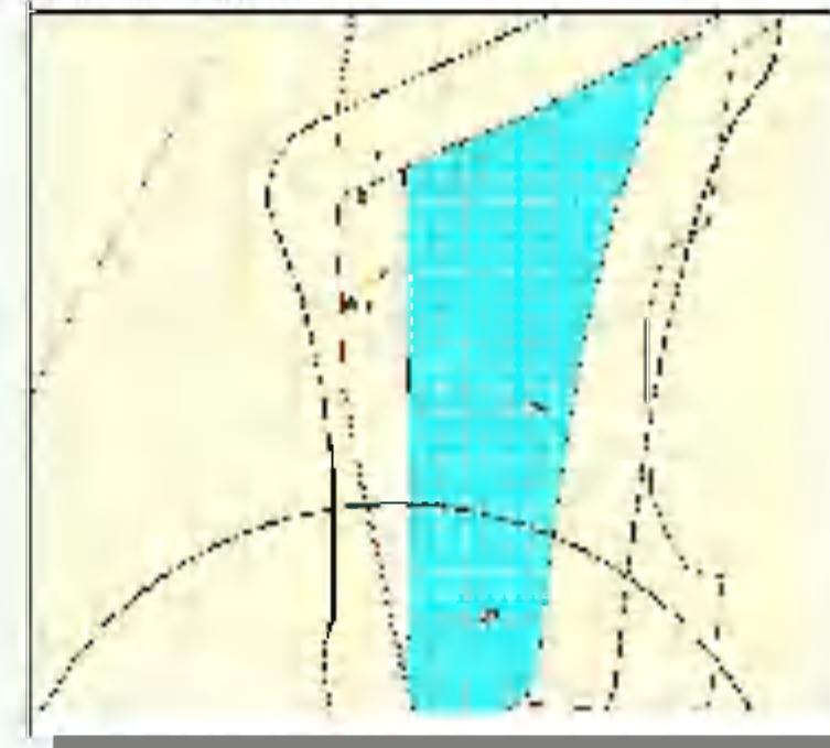
МЕСТОПОЛОЖЕНИЕ БОКН "КАПТЫРЕВО.МОГИЛЬНИК КУРГАННЫЙ 1"